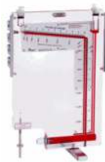
Manômetros Coluna Inclinada Portáteis